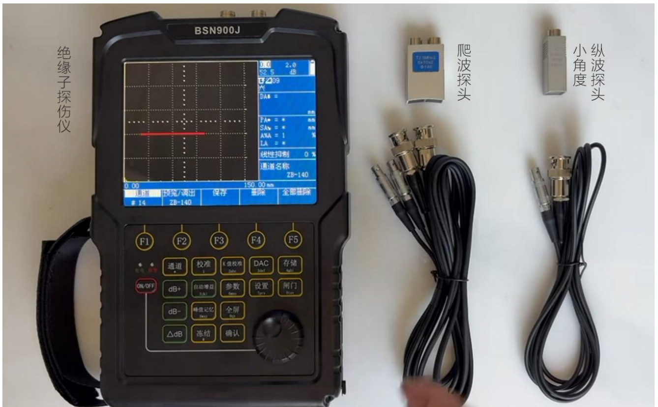
认识绝缘子探伤仪主机、爬波探头、小角度纵波探头