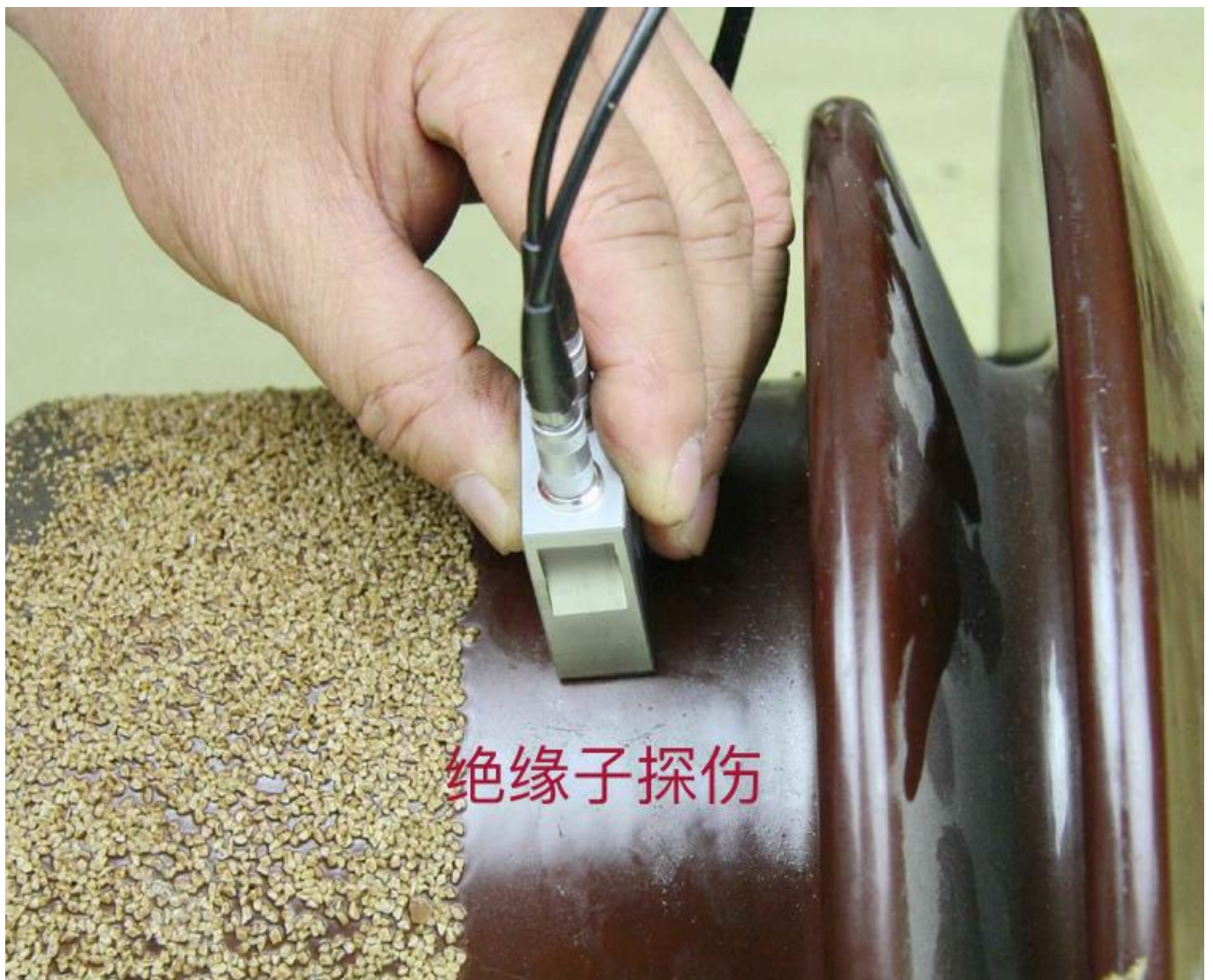
支柱瓷绝缘子探伤实操照片