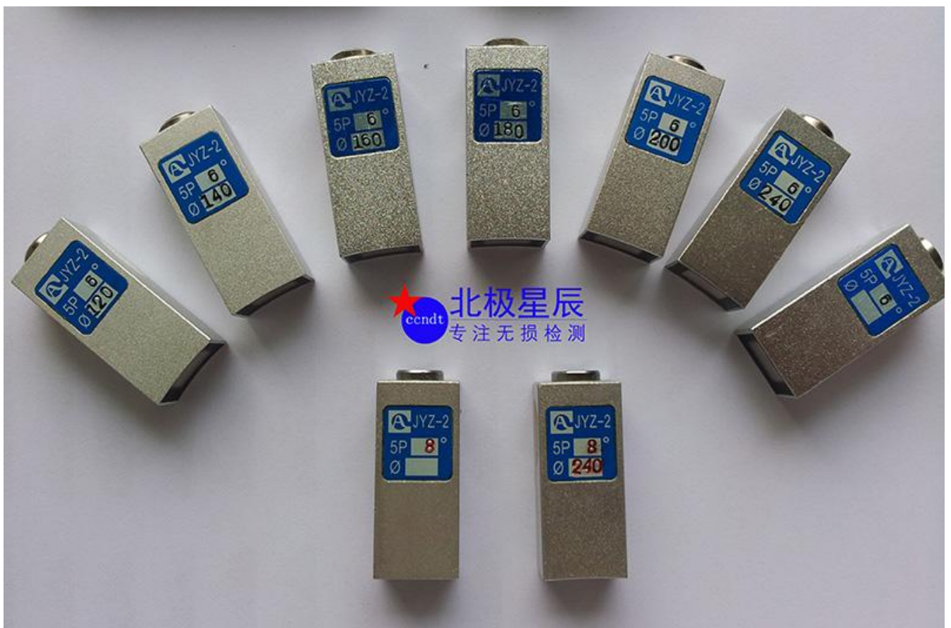
标准配准：配14个此类小角度纵波探头